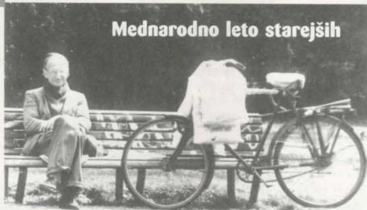
Mednarodno leto starejših

Tudi pri nas vse več starejših ljudi ostaja v pokoju še naprej dejavnih in vključenih v okolje izven družinskega življenja, zato nekdanje stereotipne slike babic in dedkov niso več ustrezne. Vse več institucij in društev se zaveda, da stiki različnih generacij nedvomno bogatijo tako ene kot druge. Zato tudi že tečejo projekti, ki naj bi se razvili v trajnejše oblike srečevanja starejših in otrok. Eden od tovrstnih prispevkov k mednarodnemu letu starejših je tudi projekt "Babica in dedek pripovedujeta", ki so ga pripravili v Pionirski knjižnici, enoti Knjižnice Otona Župančiča v