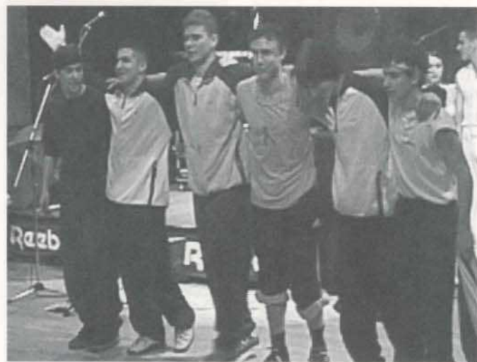
Plesaici skupine Street elements – društva Interes